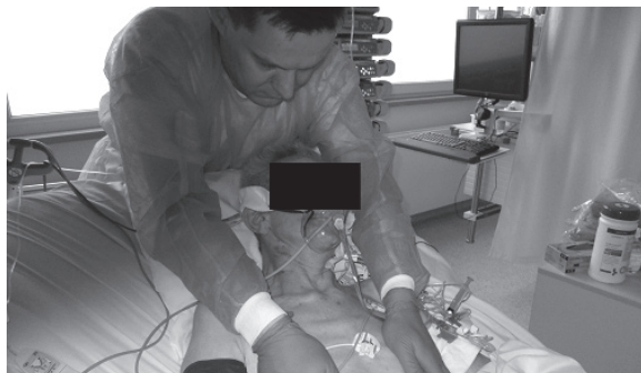
Fotografia 8. Torowanie oddychania dolnożebrowego Photo 8. Paving the way of breathing at the bottom of rib

Photo 7. Paving the way of breathing at the top of rib