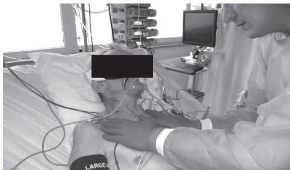
Fotografia 7. Torowanie oddychania górnożebrowego

mostka, żeber i przepony (fotografia 7). W celu poprawy siły wydechu ćwiczenia powinny obejmować także mięśnie brzucha. Poprzez ćwiczenia oddechowe można uruchamiać klatkę piersiową, kręgosłup, tułów, obręcz barkową, zmniejszyć odczucia bólowe pacjenta a także zredukować spastyczność i zrelaksować chorego [35,36] (fotografia 8). Długotrwałe unieruchomienie pacjenta w łóżku może skutkować dolegliwościami bólowymi kręgosłupa w odcinku szyjnym. Zastosowanie ćwiczeń oddechowych wg koncepcji PNF znacząco zwiększa zakresu ruchomości odcinka szyjnego, redukuje ból i patologicznie zwiększone napięcie mięśniowe pośrednio wpływając na zwiększenie pojemności i ruchomości klatki piersiowej [36] (fotografia 9).