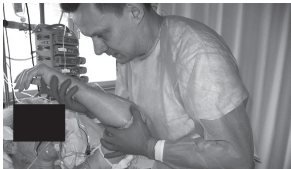
Fotografia 3. Wzorce kończy górnej (torowanie funkcji kończyny górnej ze stymulacją ekstero- i proprioceptywną)

Photo 2. Patterns of torso lying on its side: the combination patterns of shoulders and pelvis (strengthening the trunk, preparing for priming rotation, normalization of muscle tension)