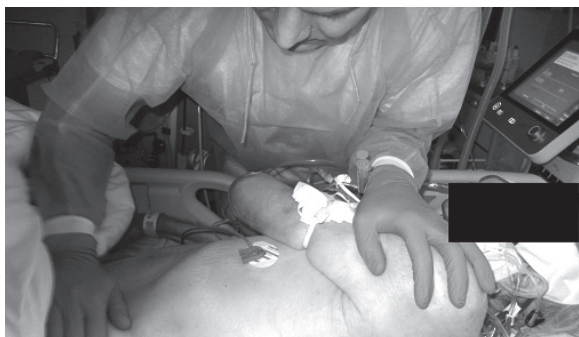
Fotografia 6. Torowanie obrotu (wykorzystanie kombinacji wzorców łopatki i miednicy ze skróceniem tułowia)

Photo 5. Patterns of leg (lower extremity strengthening and irradiation voltage on the trunk)