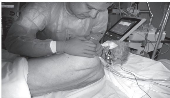
Fotografia 1. Wzorce łopatki w leżeniu na boku (swobodne poruszanie się kości ramiennej z łopatką, wspomaganie pracy zginania/prostowania tułowia, irradiacja do skracania/wydłużenia tułowia, przygotowanie do funkcji kończyny górnej i do torowania obrotów)

Photo 1. Patterns of shoulder blades lying on its side (to move freely in the humerus with a scapula, assist the work of flexion / extension of the trunk, irradiation for shortening / lengthening of the trunk, preparing for upper limb function and to paving the rotation)