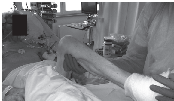
Fotografia 5. Wzorce kończyny dolnej (wzmacnianie kończyn dolnych i irradycja napięcia na tułów)

Infekcje układu oddechowego – tchawicy, oskrzeli, płuc - są jednym z najczęstszych powikłań leczenia chorych w stanie krytycznym [33]. Z tego względu podstawowym celem rehabilitacji oddechowej powinno być zapobieganie negatywnym skutkom, na jakie narażony jest chory przebywający na oddziale intensywnej terapii, które wynikają zarówno z przyczyn skierowania pacjenta do placówki oraz długotrwałego przyjmowania pozycji leżącej [34].