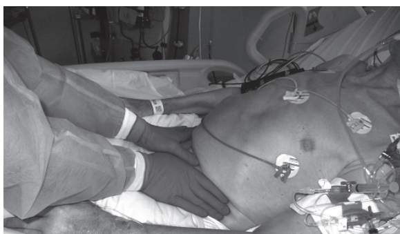
Fotografia 10. Pośrednia stymulacja przepony poprzez mięśnie brzucha

Photo 9. Breathing in the supine position. Pressure on the sternum