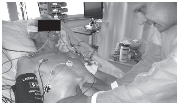
Fotografia 11. Stymulacja przepony

po całkowitym uszkodzeniu kręgosłupa szyjnego. W grupie chorych ze stwierdzoną tetraplegią wykazano 67-procentową poprawę pojemności życiowej, podczas gdy u kontrolnej grupy, wykonującej rehabilitację oddechową bez elementów pracy z oporem – 27-procentową poprawę. Na uwagę zasługuje fakt przyrostu siły mięśni oddechowych w badanej grupie chorych z tetraplegią. Zaobserwowano również znaczący przyrost obwodu klatki piersiowej oraz zmniejszenie epizodów duszności w grupie pacjentów wykonujących oporowe ćwiczenia oddechowe.