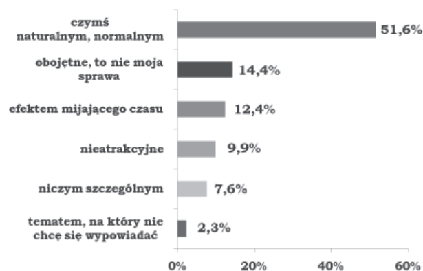
Wykres 3. Ciało człowieka starego jest dla mnie... Figure 3. The body of an old man is for me ...

Poproszono studentów o dokończenie rozpoczętych zdań, zgodnie z ich indywidualnymi przekonaniem. Jedno z nich brzmiało „Ciało człowieka starego jest dla mnie...” Wykres 3 ilustruje jakich odpowiedzi udzielali badani.