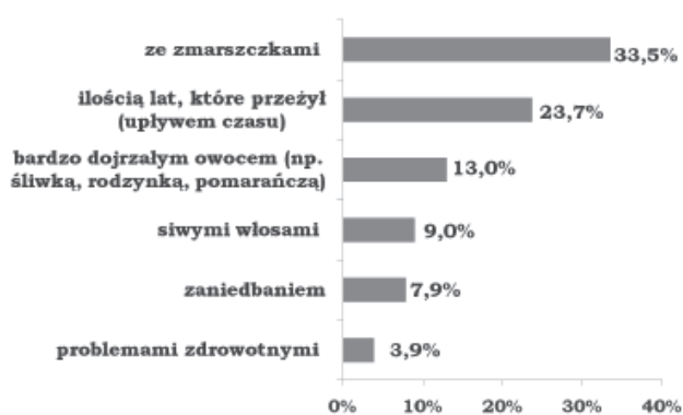
Wykres 4. Ciało człowieka starego w pierwszej kolejności kojarzy mi się z....

na ilość lat, którą dana osoba przeżyła – na takie skojarzenia związane z ciałem seniora wskazywali badani. I podobnie jak przy poprzednim pytaniu, tak i w tym, w mniejszości byli ci, którym cielesność człowieka starszego kojarzy się z zaniedbaniem. Ciało zaniedbane to ciało nieatrakcyjne, czyli osoby, które o tym mówiły, patrzyły na cielesność seniora przez pryzmat jego wyglądu i atrakcyjności.