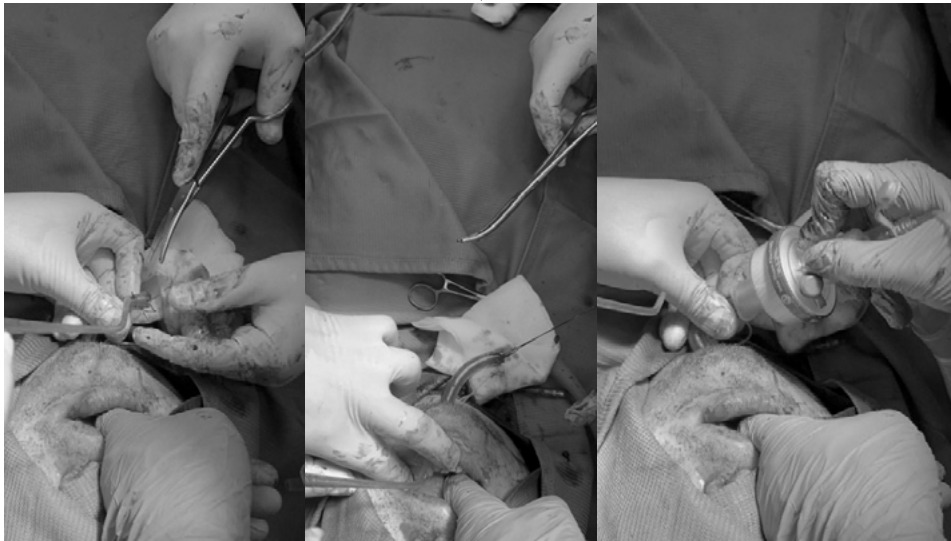
Rycina 5. Rurka intubacyjna zostaje przeciągnięta przez otwór w dnie jamy ustnej, nici chirurgiczne zostają usunięte, a następnie przez nałożony adapter rurka intubacyjna zostaje podłączona do aparatu do znieczulenia. Rurka intubacyjna musi być podciągnięta na odpowiednią długość, aby nie przeszkadzała podczas czynności chirurgicznych, ale jednocześnie nie może być zbyt napięta, ponieważ powoduje to niebezpieczeństwo przypadkowej ekstubacji.