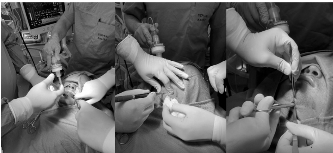
Rycina 3. Wykonanie w przestrzeni podbródkowej kanału prowadzącego do dna jamy ustnej. Końcówka narzędzia przebija błonę śluzową dna jamy ustnej około 2 cm od linii środkowej i fałdu podjęzykowego.

cza, nosowo-tchawicza, tchawiczopodbródkowa, zatrzonowcowa oraz tracheostomia. Sposób udrożnienia dróg oddechowych zależy od rodzaju urazu, charakteru zabiegu operacyjnego oraz przewidywanej długości wentylacji mechanicznej. Każda z tych metod ma swoje wady i zalety (tabela I). Tracheostomia oraz intubacja tchawiczopodbródkowa umożliwiają wykonanie zabiegu u chorych z obrażeniami twarzoczaszki bez ograniczenia dostępu chirurgicznego i swobody działania operatora. Intubacja tchawiczopodbródkowa jest metodą, która w porównaniu z tracheostomią wypada korzystniej, szczególnie pod względem bezpieczeństwa. Jundt w analizie 842 zabiegów intubacji tchawiczobródkowej nie odnotował żadnego ciężkiego powikłania [2]. Łżejsze powikłania wystąpiły u 60 chorych. Były to: zakażenie skóry (2,73%- 23 przypadki), czasowa przetoka w miejscu kanału chirurgicznego (1,19%- 10 przypadków), krwawienie żyłne (0,24%- 2 przypadki), przerośnięta blizna w miejscu nacięcia skóry (0,36%- 3 przypadki), przejściowe porażenie nerwu językowego (0,12%- 1 przypadek), nadżerka błony śluzowej dna jamy ustnej (0,12%- 1 przypadek). Ponadto w czasie zabiegu wystąpiły trudności techniczne takie jak: przypadkowa ekstubacji (0,24%- 2 przypadki), przemieszczenie się rurki intubacyjnej do prawego oskrzela głównego (0,59%- 5 przypadków), uszkodzenie rurki intubacyjnej (1,19%-