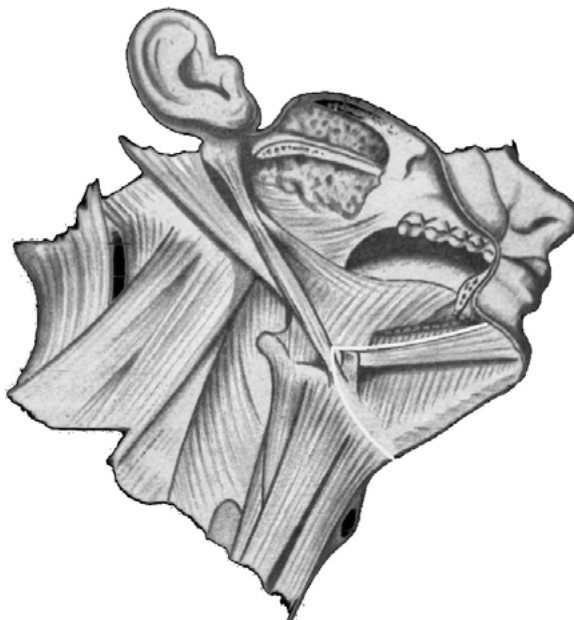
Rycina 1. Przestrzeń podbródkowa

znaczona była do docelowego udrożnienia dróg oddechowych [9]. Biswas stosował zestaw do tracheostomii metodą Griggsa do wytworzenia kanału przezskórnego [10]. Nyarady dokładnie określił optymalne miejsce przejścia rurki przez dno jamy ustnej zapewniające największe bezpieczeństwo tej procedury za pomocą reguły 2-2-2: nacięcie o długości 2 cm, 2 cm od linii środkowej dna jamy ustnej i 2 cm równoległe do brzegu żuchwy [11].